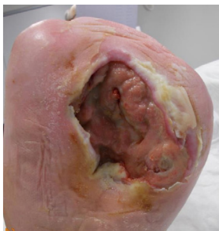
Abb. 1 Veränderung der Wundsituation bei einem Patienten mit Diabetischem Fußsyndrom. Zwischen den beiden Aufnahmen links und rechts liegen vier Wochen.