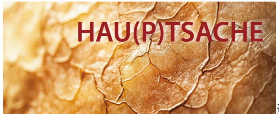
Leitbild des Themas des SAfW-Symposiums 2025.